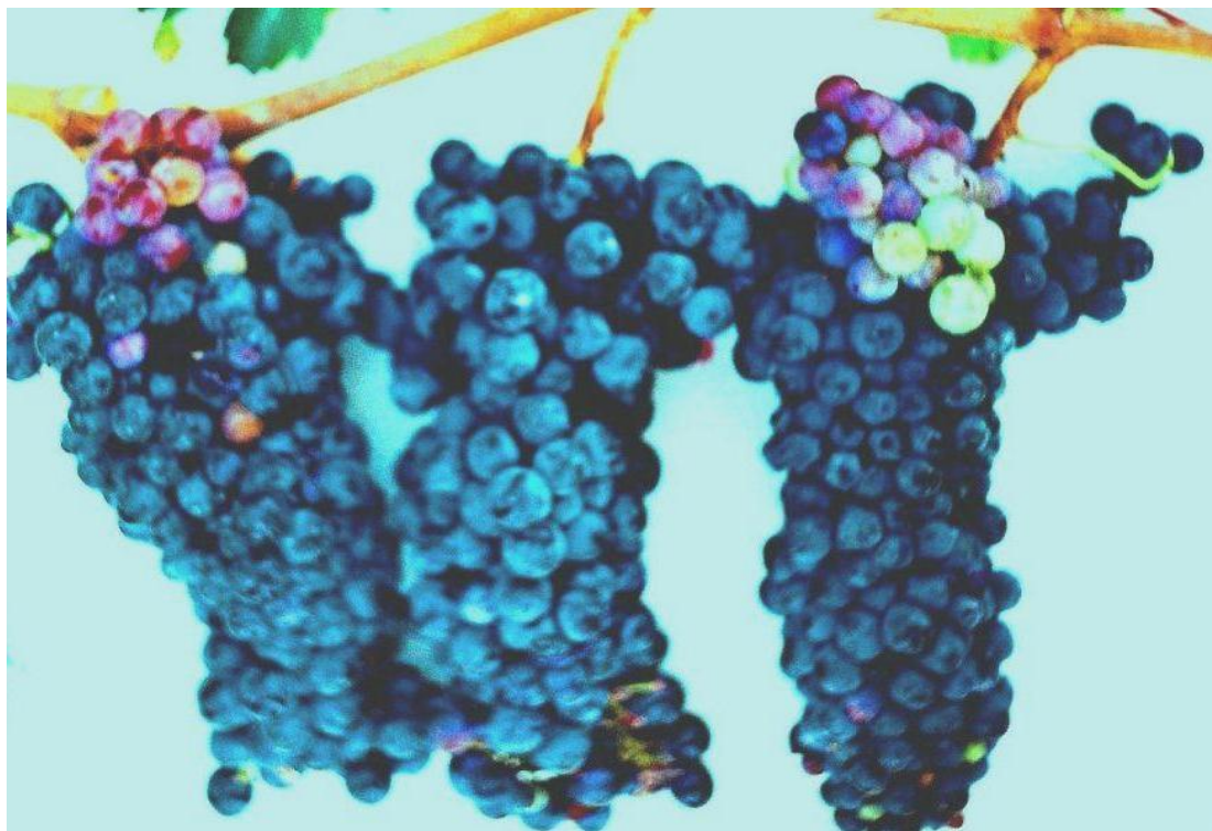
Рис. 2. Гроздь сорта Узунсалхымлы

Ампело-дескрипторная характеристика: На современном этапе развития виноградарства, согласно требованиям Международного Института Генетических Ресурсов Растений в Италии [IPGRI], для успешного использования в научных и хозяйственных целях различных сортов.