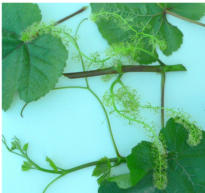
Рис 1. Грозд сорта Алинджа

Осыпание цветков и горошение ягод очень низкое. Сорт очень слабо подвергается грибным болезням: милдью - 1 балла, оидиум - 2 балла. Сорт очень чувствителен к недостатку влаги в почве. В связи с большой силой роста требует мощных формировок.