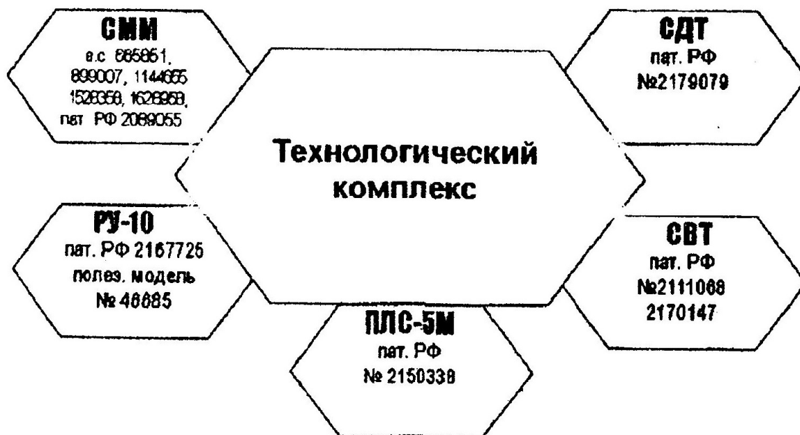
Рисунок 3 – Структурная схема технологического комплекса технических средств для обработки семян

Первичную обработку семян проводят на машине СММ [6, 10, 11], в которой процесс осуществляется по непрерывной схеме при двухстадийном воздействии рабочих органов на семена. На первой стадии обработка происходит в загрузочном бункере («мягкий» режим) и на второй стадии – непосредственно в обескряливателе (оптимальный режим) [2, 3]. Предварительная очистка семян осуществляется в воздушной системе, состоящей из вертикального аспирационного канала, осадочной камеры и вентилятора, а сортирование – на решетном стане.