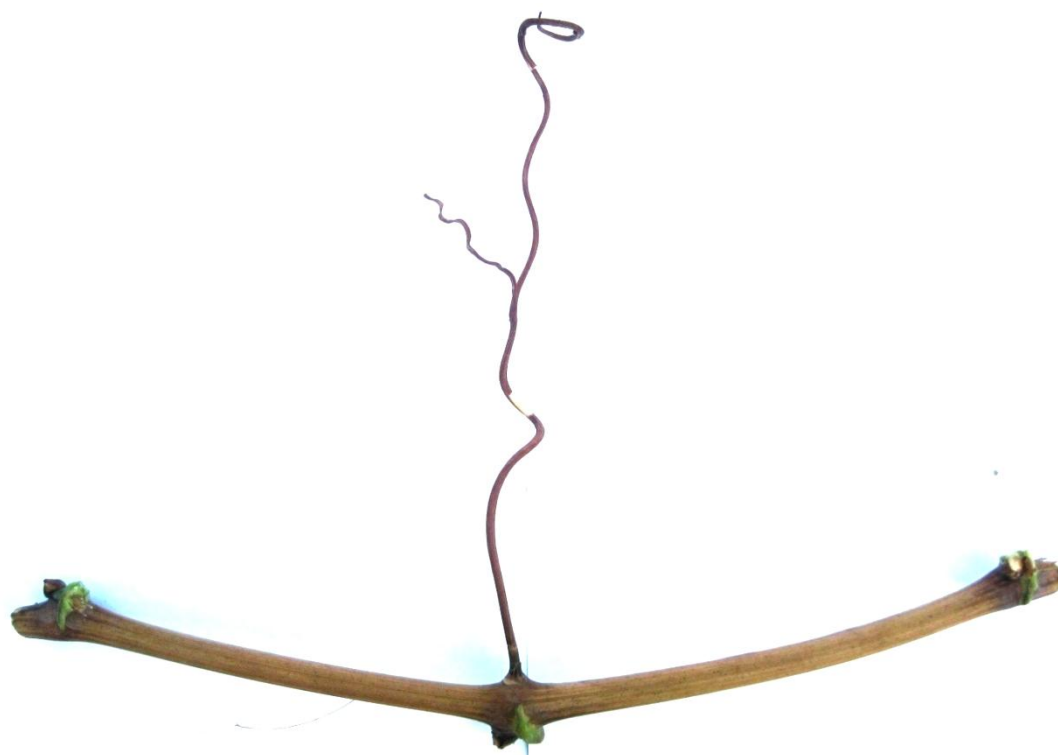
Рис. 9-10. Распустившийся глазок и одревесневший побег сорта винограда Кормилица Лиза

229 - пупок семени: 2 - видимый, выраженный;