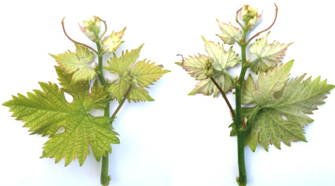
Рис. 1-2. Верхушка молодого побега сорта винограда Кормилица Лиза

014 - интенсивность (плотность) паутинистого опушения на междоузлиях: 3 – отсутствует или очень слабое (очень редкое);