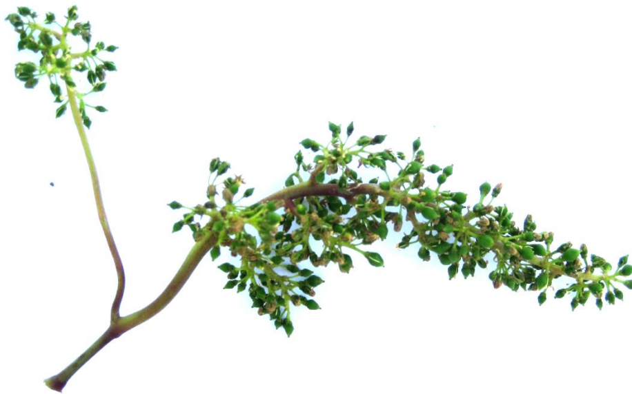
Рис. 5. Соцветие сорта винограда Кормилица Лиза