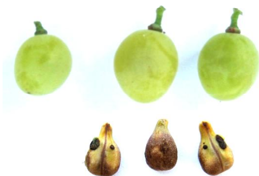
Рис. 6-8. Гроздь, ягоды и семена сорта винограда Кормилица Лиза