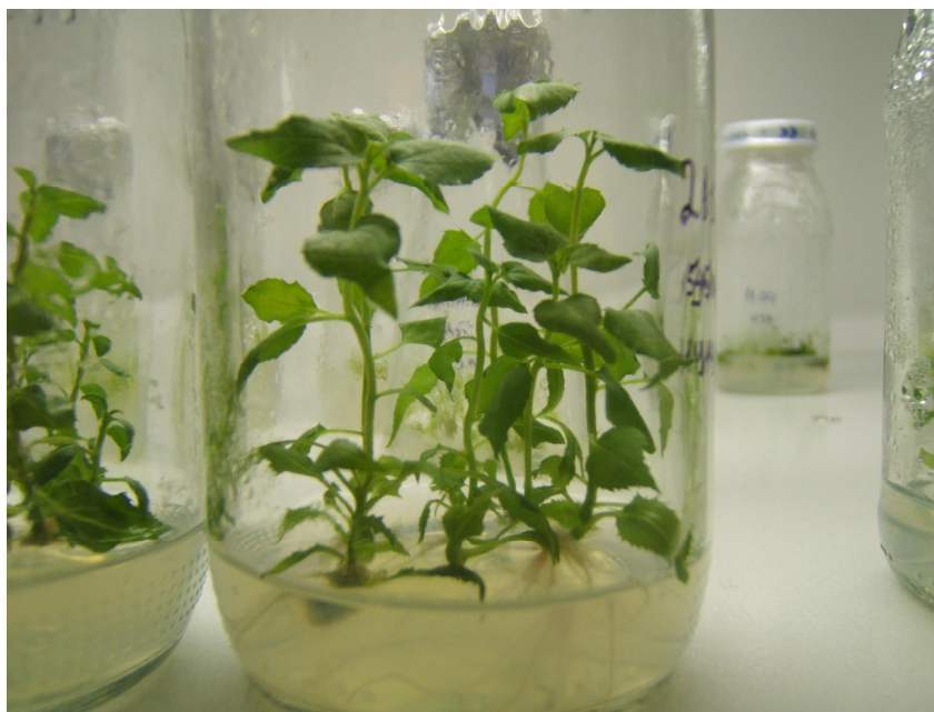
Рисунок 3 – Populus tremula L. клон №35

Одним из определяющих факторов оказывающих существенное влияние на рост и развитие эксплантов в культуре in vitro является минеральный состав питательной среды.