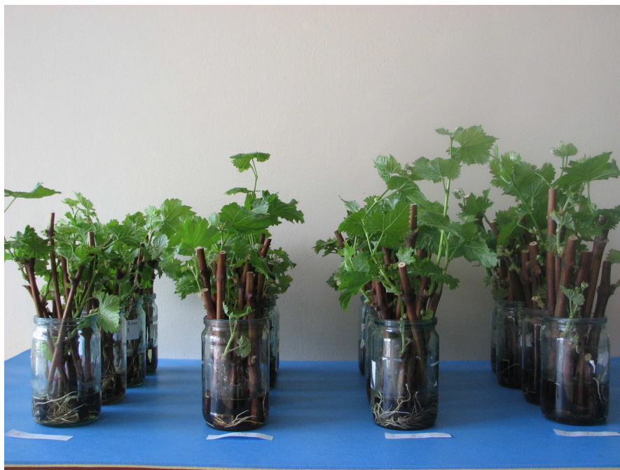
Рисунок 1 - Черенки сорта Молдова различной толщины, укореняющиеся в сосудах с водой, 2012 г.

После вымачивания черенки устанавливали на укоренение в стеклянные емкости с водой (рисунок 1). Слой воды в емкостях поддерживали на уровне 3-4 см. Проращивание проводилось в комнате на общем обогреве при естественном свете. Температура воздуха в помещении была в пределах 20 °С. В каждом варианте было по 40 черенков (4 повторности по 10 черенков в каждой). Для удобства проведения учетов и наблюдений все черенки были пронумерованы.