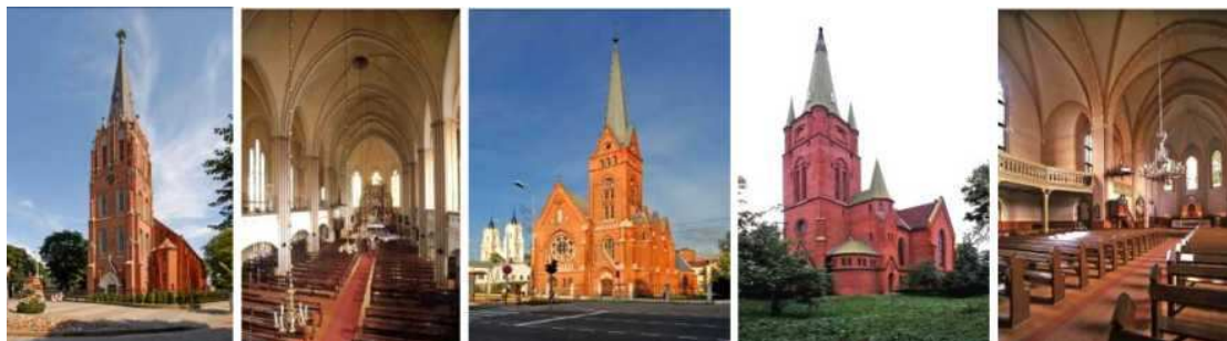
Рисунок 25. Лиепая. Церковь Святой Анны. Башня. 1872-1873.

выражением неоготики, она ближе к романской готической архитектуре (рисунок 28, 29).