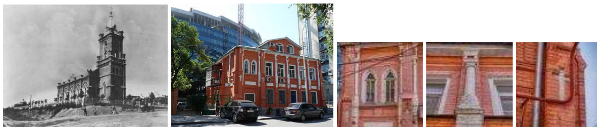
Рисунок 57. Ростов-на-Дону. Евангелическо-лютеранская церковь.