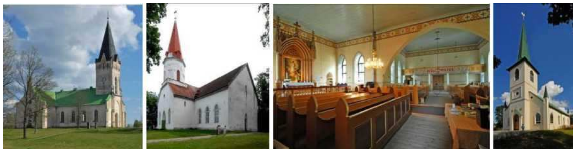
Рисунок 41. Яунпиебалга. Евангелическо-лютеранская церковь.

Экспрессия неоготики прослеживается и в архитектуре относительно простых церквей, у которых внешние стены отделаны побеленной штукатуркой (рисунок 41- 43).