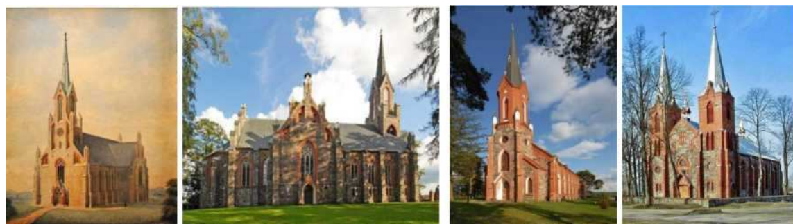
Рисунок 44. Cesvaine. Евангелическо-лютеранская церковь. 1875-1879. Фасад.