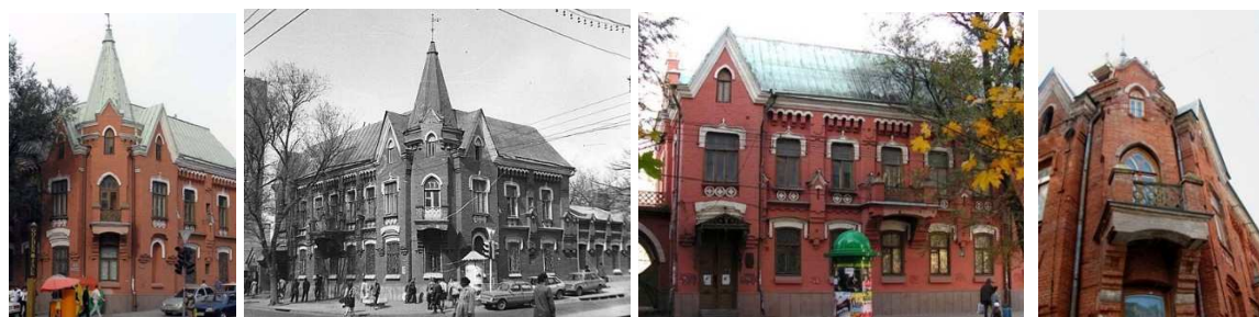
Рисунок 60. Ростов-на-Дону. Дом братьев Мартын. 1893г. Н.М. Соколов.

кованая ограда (не сохранилась) с чугунными литыми стойками. В декоративном решении фасадов домика пастора присутствуют детали, заимствованные из разнообразных источников. Можно увидеть «общеготические» мотивы – тянутые пилястры по сторонам оконных проемов, стрельчатые арки, стилизованное контрфорсы, ступенчатые консоли, напоминающие машикули.