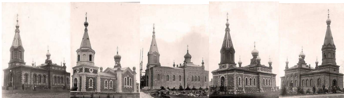
Рисунок 48. Церковь Святой Троицы Ладенормского прихода. 1888-1889г.

культовых сооружений, следующий за вытянутой прямоугольной трапезной, имеет в плане правильную квадратную форму, перекрыт скатной четырёхгранной кровлей с пятью куполами и переходит в алтарную часть церквей. И в готической шатровой башне, и в прямоугольной трапезной, и в арочных более или менее стрельчатых окнах, как и во всём архитектурном строе рассматриваемых сооружений, можно проследить влияние неоготики, характерной для протестантских и католических храмов. Таким образом, происходит перенос отдельных форм неоготики в православное храмостроение, что следует рассматривать как проявление контекстуализма. Доминирование в силуэте высоких завершенных шатрами колоколен, вытянутость композиции по продольной оси, сообщающей храмам некоторую «базиликальность» образного строя, а также скромные по сравнению с колокольней размеры пятиглавия характерны для всех рассматриваемых построек. Это отличительная особенность неоготической православной архитектуры «кирпичного стиля» Эстляндии (рисунок 48-52).