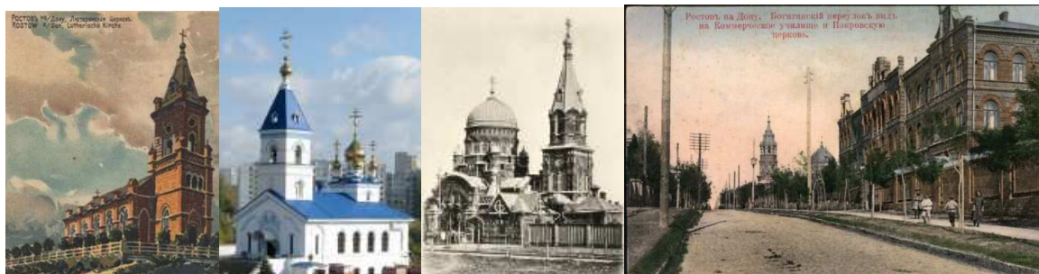
Рисунок 53. Ростов-на-Дону. Евангелическо-лютеранская церковь. 1888г. Н.М. Соколов.