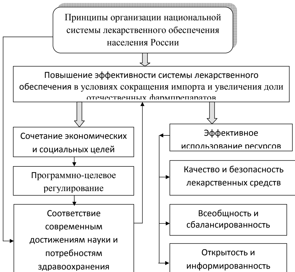
Рисунок 1 – Схема реализации основных принципов системы лекарственного обеспечения населения России в условиях импортозамещения [8].

Следует подчеркнуть, что кризисное состояние мировой экономики внесло некоторые коррективы в параметры реализации федеральной целевой программы, стоимость которой, в соответствии с постановлением №519 от 9 июня 2016 г. сократилась на 37,7 млрд. руб. (21,8%), а финансирование научных исследований прикладного характера уменьшилось на 25,5 млрд. руб. (29,3%) [7]. Одновременно в рамках реализации политики импортозамещения госпрограмма дополнена специальными мерами по предоставлению льгот и субсидий