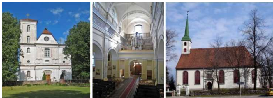
Рисунок 16. Скайсткальне. Вознесенская церковь Успения Марии.