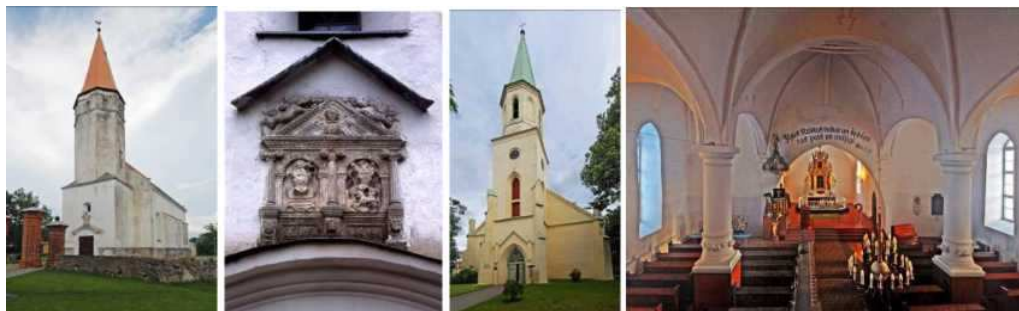
Рисунок 12. Нерете. Лютеранская церковь. 1584-1593. Западный фасад.