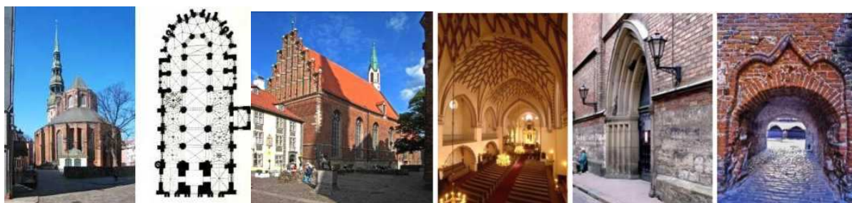
Рисунок 8. Рига. Евангелическо-лютеранская церковь Святого Иоанна.

середине XV века, когда новый алтарь церкви Святого Петра был связан с древней западной оконечностью, боковые нефы были покрыты великолепными звездчатыми сводами. Особенным богатством отличается узор четвертого свода на южной стороне здания, выходящего на площадь. Северо-западный фасад венчает живописный готический ступенчатый фронтон из профилированного кирпича, яркая вертикальность колонн которого сбалансированно замедляется горизонтальными оштукатуренными полосками. Арки над воротами кирпичной стены выполнены в типичных формах поздней готики [6].