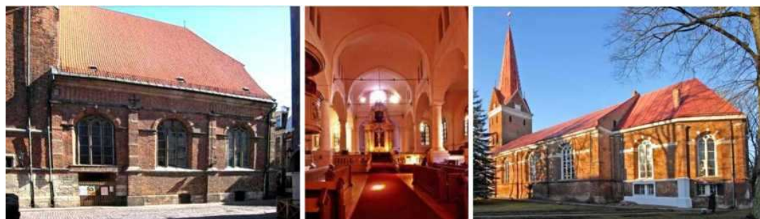
Рисунок 9. Рига. Евангелическо-лютеранская церковь.

Идеи Ренессанса чётко прослеживаются и в дизайне церкви Святой Анны в Елгаве (1619-1621). Башня и боковые фасады имеют очень похожую евангелическо-лютеранскую структуру (рисунок 11).