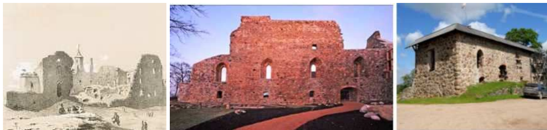
Рисунок 4. Развалины замка в Гапсале.