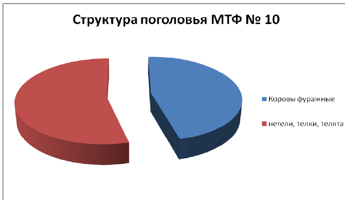
Рисунок 2 – Распределение животных на МТФ № 10

В таблицах 4-5 приведена информация, позволяющая судить о воспроизводительных качествах коров голштинской породы в АО Агрообъединение «Кубань».